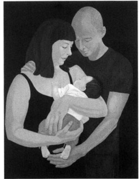
Kleine Isa, olie op doek